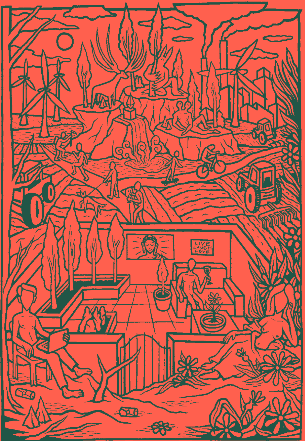
Iwan Smit, mural for Dissident Gardens , Het Nieuwe Instituut, 2018.